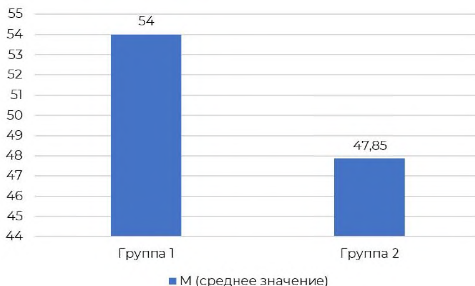
Рисунок 1 – Средние значения по показателю «Планирование решения» между исследуемыми группами

Реактивная тревожность, также известная как ситуативная тревожность, представляет собой временное эмоциональное состояние, характеризующееся субъективно переживаемыми ощущениями напряжения, беспокойства, нервозности и опасений. Это реакция на воспринимаемую угрозу или стрессовую ситуацию, которая возникает здесь и сейчас. У женщин с высокой/умеренной степенью выраженности климактерического синдрома симптомы (такие как частые и интенсивные приливы жара, обильное ночное потоотделение, нарушения сна, учащенное сердцебиение, головные боли, перепады настроения, вагинальная сухость и дискомфорт) являются не просто неприятными ощущениями, а постоянными, часто непредсказуемыми и изматывающими стрессорами. Каждый новый приступ прилива, каждая бессонная ночь или эпизод резкого изменения настроения воспринимаются организмом и психикой как угроза комфорту, контролю над собой и нормальному функционированию. Наглядно данные по показателю «Реактивная тревожность» представлены на рисунке 2.