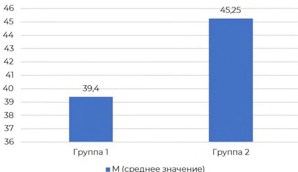
Рисунок 2 – Средние значения по показателю «Реактивная тревожность» между исследуемыми группами

Личностная тревожность, в отличие от реактивной (ситуативной) тревожности, представляет собой устойчивую индивидуальную характеристику, отражающую предрасположенность человека к восприятию широкого круга ситуаций как потенциально угрожающих, реагированию на них состоянием беспокойства, напряжения и тревоги. Женщины с изначально высоким уровнем личностной тревожности вступают в период менопаузы, уже обладая повышенной чувствительностью к стрессу и склонностью интерпретировать различные изменения (в том числе физиологические) как угрожающие.